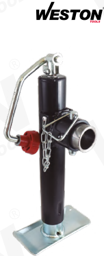
MIN: 1 / INN: 120

Fabricado en acero Gato con tubo redondo Soldable Manivela lateral