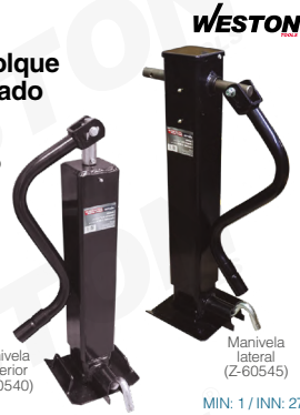
MIN: 1 / INN: 27

Fabricado en acero Gato con tubo cuadrado Soldable